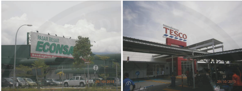
Rajah 3 Pasar raya besar di Kawasan Kajian

Selain itu, kewujudan penawaran fungsi-fungsi ekonomi moden yang lain seperti ejen insurans/takaful, ejen tiket, syarikat kurier serta hotel pada jumlah yang memuaskan merupakan petunjuk awal bahawa kawasan kajian sedang menerima limpahan globalisasi ekonomi dari kawasan teras wilayah metropolitan.