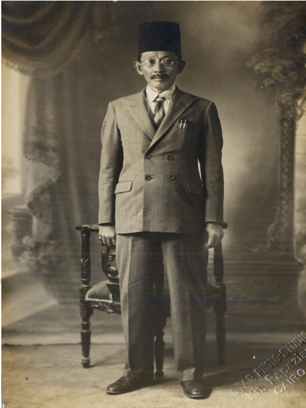
Syeikh Tahir Jalaluddin