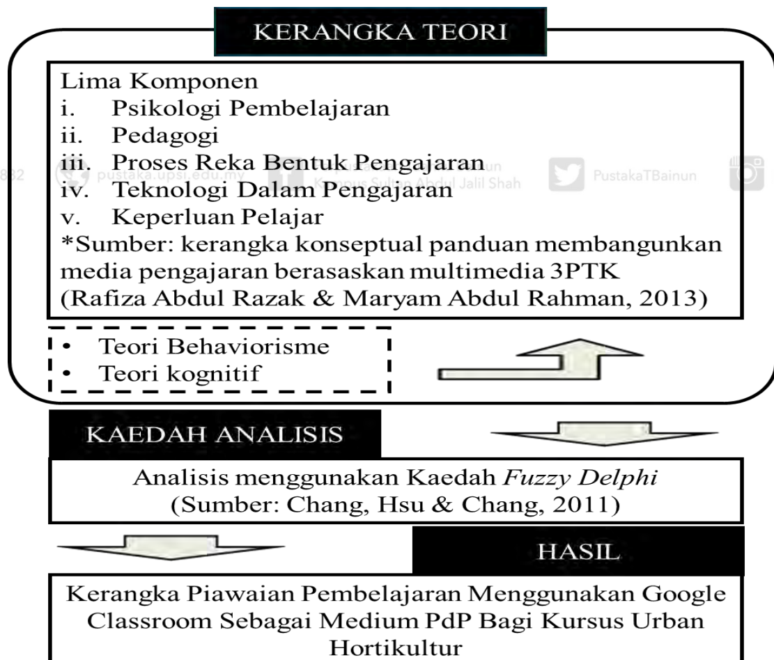
Kerangka Konseptual Kajian