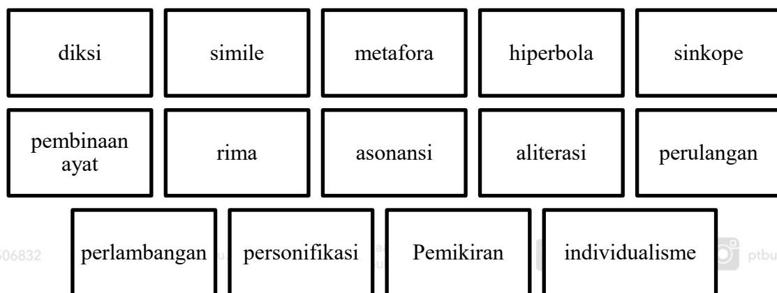
Rajah 1.3 Unsur-unsur Gaya Bahasa

pembinaan ayat dan sebagainya. Gaya bahasa bagi sesuatu penulisan atau hasilan akan disempurnakan melalui pengaplikasian stail atau unsur-unsur keindahan oleh penulis atau penyair untuk menarik minat dan perhatian pembaca. Antara gaya bahasa dan unsur keindahan yang selalu diaplikasikan oleh penulis atau penyair untuk memastikan penulis yang disumbang menarik perhatian pembaca dari unsur-unsur seperti yang berikut :