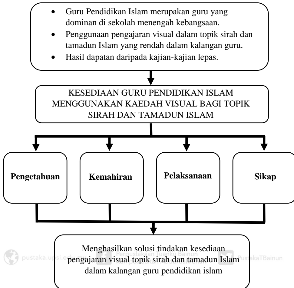
Rajah 1.1. Kerangka Konseptual Kajian