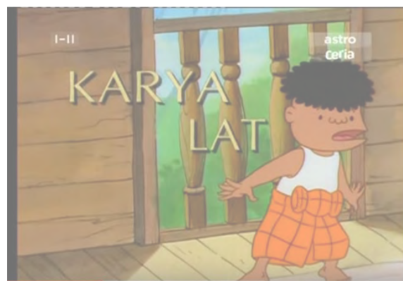
Gambar 1.2. Watak utama dalam komik “Kampung Boy”