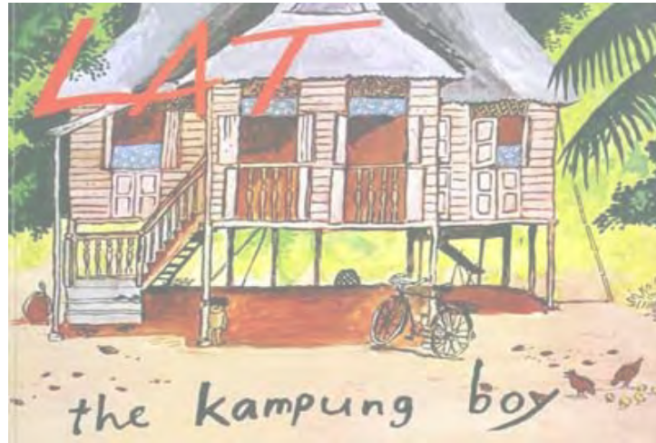
Gambar 1.1. Komik “Kampung Boy”

Gambar 1.1 di atas merujuk kepada kulit depan komik “Kampung Boy” yang menggambarkan rumah tradisional orang Melayu di Perak, iaitu tempat tinggal