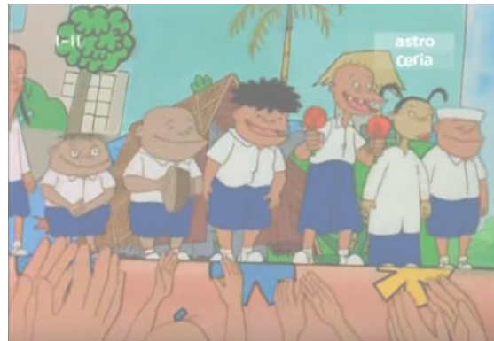
Gambar 1.3. Watak-watak sampingan yang terdapat dalam komik “Kampung Boy”

Gambar 1.2 pula merujuk kepada watak utama dalam komik iaitu Mat. Mat tinggal bersama ibu bapanya dan seorang adik perempuan. Bapanya lebih mesra dengan panggilan Yup. Adik perempuannya pula bernama Ana. Mat juga mempunyai nenek tetapi tidak tinggal bersama mereka. Mat memanggil neneknya dengan panggilan opah.