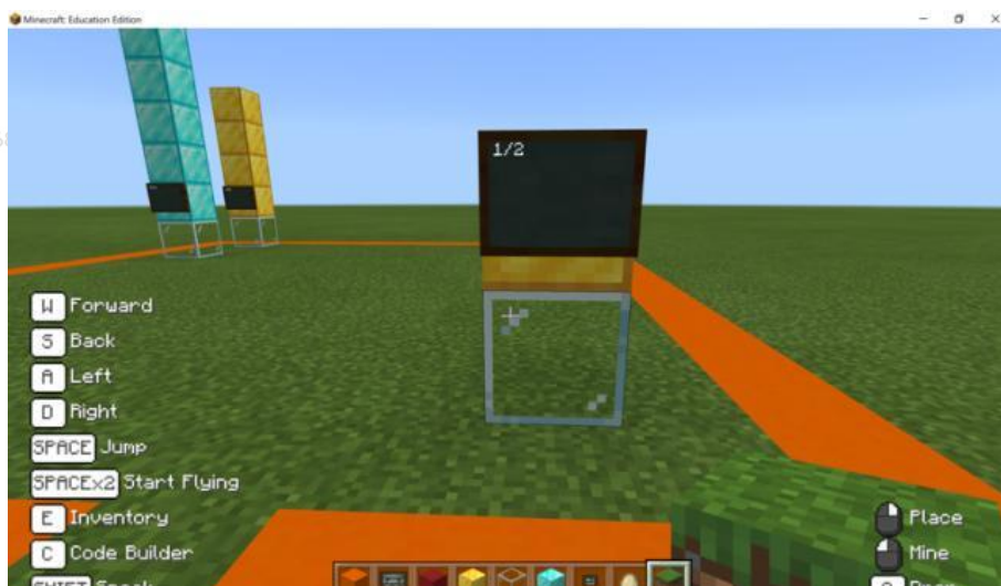
Rajah 1: Susunan blok yang membentuk nilai pecahan ‘satu per dua’

blok tersebut, yang juga dikenali sebagai manipulatif iaitu bahan atau objek yang dimanipulasi, aktiviti berkaitan operasi asas seperti menambah, menolak dan mendarab pecahan dapat dilakukan dalam persekitaran dunia Minecraft. Pelaksanaan aktiviti hands-on ini akan membantu mewujudkan hubungan antara aktiviti berkenaan dengan konsep pecahan yang abstrak kerana dengan berinteraksi serta melakukan aktiviti secara hands-on , kemahiran matematik murid akan dapat dipertingkatkan dan ini sekali gus membantu murid untuk memahami konsep matematik yang abstrak kerana murid dapat memvisualisasikan konsep tersebut dengan baik dalam minda (Holmes, 2013; Konaş, 2016). Manipulasi yang dilakukan ke atas bahan manipulatif sama ada dalam bentuk objek konkrit mahupun bentuk maya berupaya membantu dalam memperkukuh pemahaman konsep matematik (Hartshorn & Boren, 1990). Bruner (1977), Dienes (1973) dan Piaget (1965) turut menyatakan bahawa murid akan membina pengetahuan yang semakin kompleks melalui penglibatan aktif dengan bahan manipulatif. Rajah 2 menunjukkan contoh aktiviti penyelesaian masalah pecahan yang dapat disediakan oleh guru untuk dilaksanakan oleh murid di dalam persekitaran dunia maya Minecraft. Bagi menyelesaikan permasalahan berkenaan, murid perlu melakukan manipulasi hands-on terhadap kedudukan atau susunan blok tersebut dan ini dapat dilakukan dengan memecah, menambah dan menyusun blok-blok tertentu.