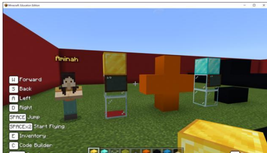
Rajah 2: Penambahan pecahan sama penyebut