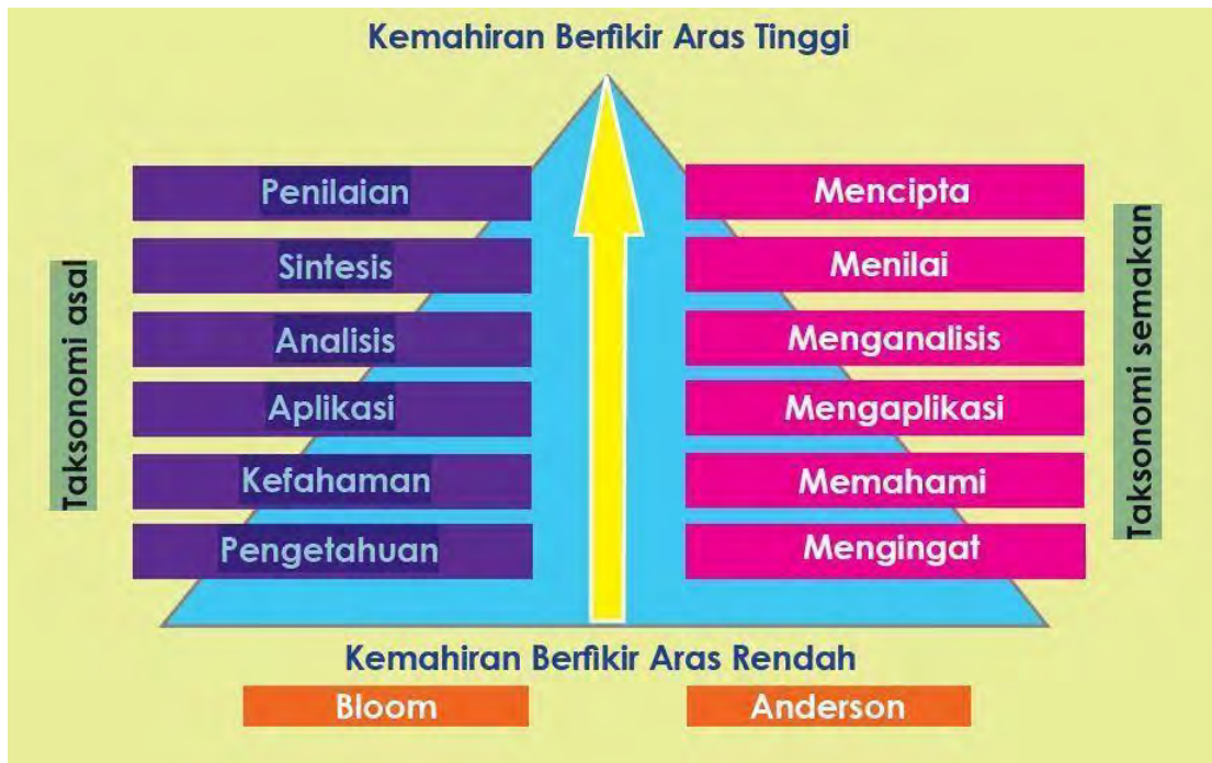
Rajah 1.3. Hierarki Aras Berfikir. Adaptasi daripada Kemahiran Berfikir Aras Tinggi Aplikasi Di Sekolah, 2014

Gambaran tahap pemikiran dalam Taksonomi Bloom semakan Anderson (1956) menunjukkan bahawa tahap pemikiran meningkat daripada aras mengingat, memahami, mengaplikasi, menganalisis, menilai sehingga mencipta. Taksonomi Bloom mengkategorikan kemahiran dan kognitif yang ingin dicapai oleh melalui tiga domain utama iaitu domain kognitif, domain afektif dan psikomotor. Pada asalnya, domain kognitif taksonomi bloom ini hanya dibahagikan kepada enam aras. Namun, beberapa perubahan telah berlaku sekitar tahun 1990-an dan perubahan ini berlaku secara berperingkat. Antara perubahan yang berlaku ialah perubahan dari sudut terminologi iaitu tema pengetahuan, pemahaman, aplikasi, analisis, sintesis dan penilaian di ubah kepada mengingat, memahami, mengaplikasi, menganalisis, menilai dan mencipta (Anderson et al. 2001).