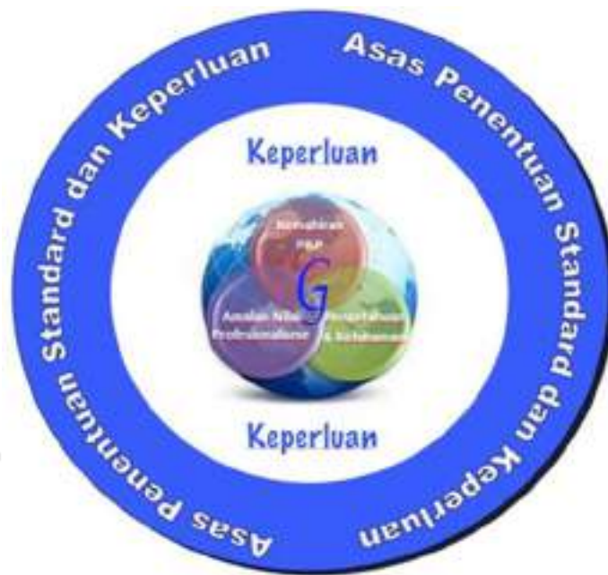
Rajah 1.1. Model Standard Guru Malaysia

Namun begitu, hasrat PPPM terletak kepada kualiti Pegawai Perkhidmatan Pendidikan (PPP) yang berkhidmat dalam sektor pendidikan. Malah, amalan dalam nilai profesionalisme keguruan yang terkandung dalam Standard Guru Malaysia (SGM) juga penting sebagai pengukur kualiti seseorang guru yang melonjakkan pendidikan abad ke-21.